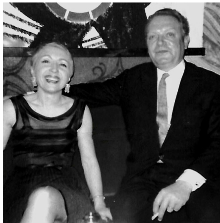
Figure marquante et incontournable de la commune, elle y a consacré sa vie à travers un double engagement exceptionnel : quarante années au service de la municipalité et un courage exemplaire au sein de la Résistance locale durant la Seconde Guerre mondiale.