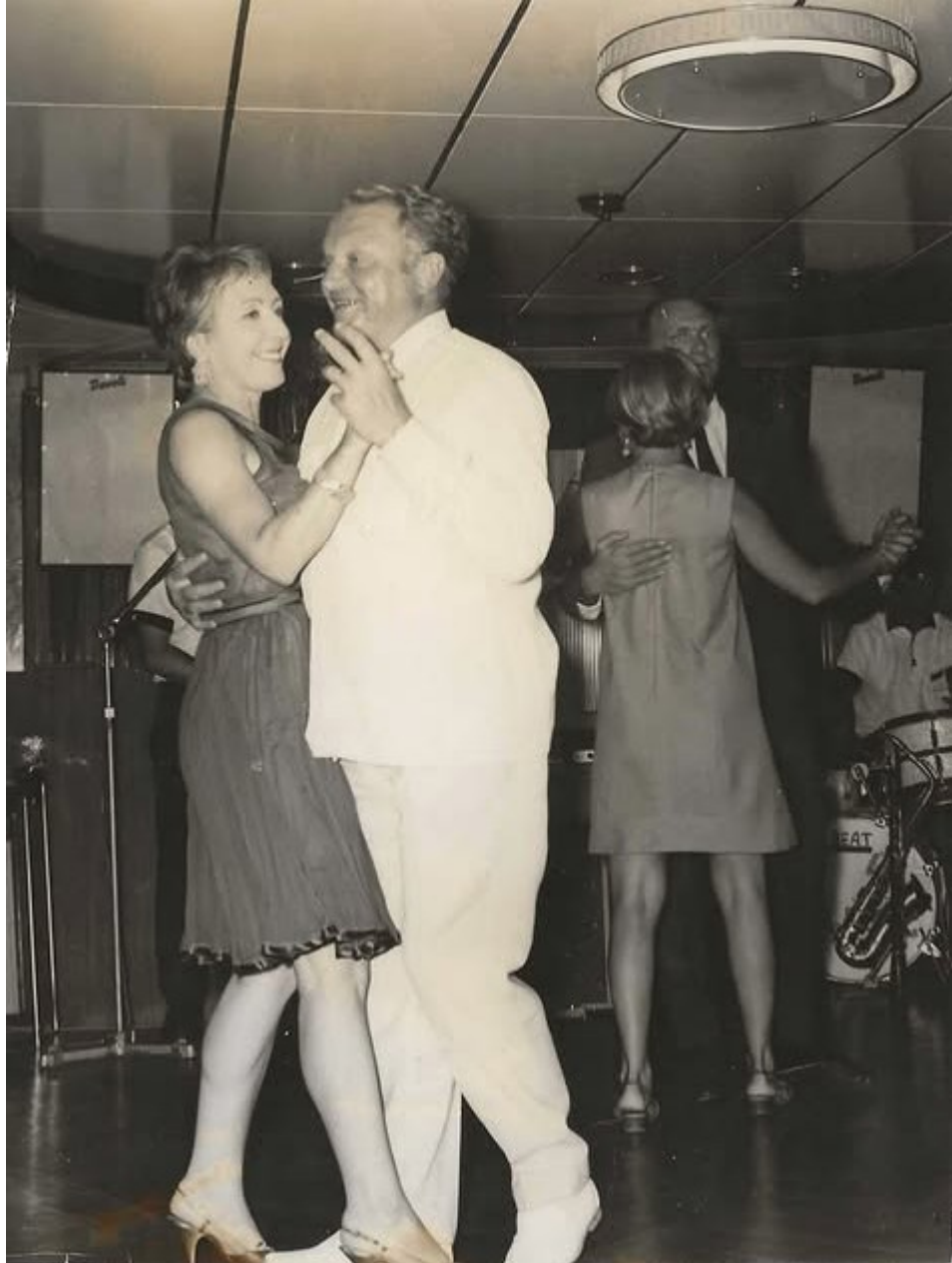
Pour compléter l'article ... un pas de danse très style et très classe du couple